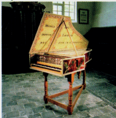
Copy of a Flemish instrument by Andreas Ruckers (1640)

William Byrd (1543, Lincolnshire - 1632, Standon Massey) ranks as the most important English composer of the Elizabethan period. He was held in very high regard, which earned him the title of 'Father of Musicke' from the members of the Chapel Royal. In 1572 Byrd was appointed organist of the Chapel Royal, the fact that he had remained Roman-Catholic notwithstanding. The Pavane and Gagliarde here played have been taken from the Fitzwilliam Virginal Book. Both dances have a tripartite structure, in which each part is repeated with variations.